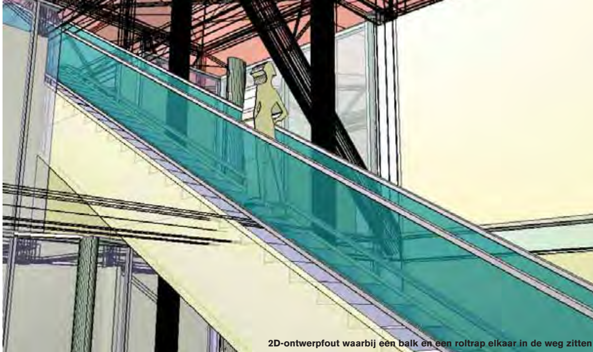
2D-ontwerpfout waarbij een balk en een roltrap elkaar in de weg zitten